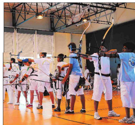
Belle affluence hier à Saint-Denis pour le deuxième rendez-vous de la saison de tir en salle.